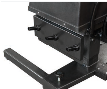
Konushalterungen Cone holder Support pour cônes