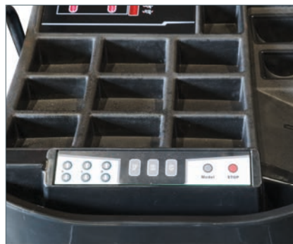
Bedienung über Frontbedienfeld Front panel control Commande par pupitre frontal