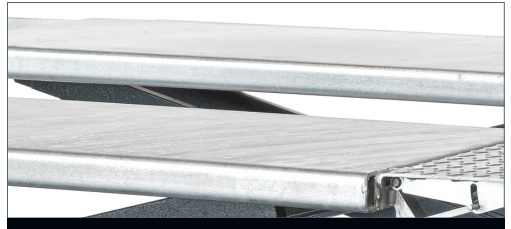
Korrosionsschutz durch Feuerverzinkung