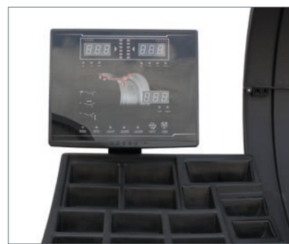
Dreifach-LED-Anzeige 3 LED displays Triple affichage LED