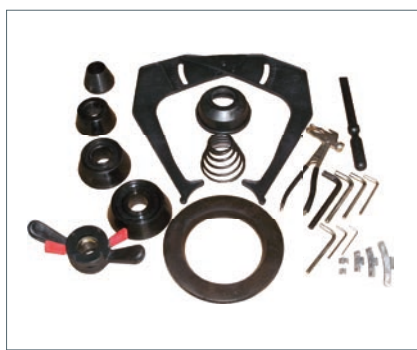
Lieferumfang Scope of delivery Contenu de la livraison