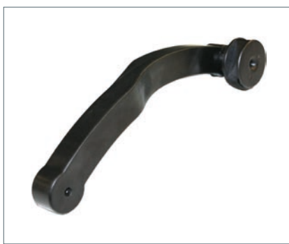
Messarm für Abstandsmaß und Felgendurchmesser Measuring arm for distance and rim diameter Bras de mesure pour déport et diamètre