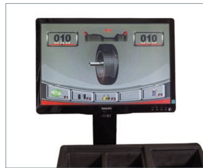
Anzeige über LCD-Monitor Displayed on LCD monitor Affichage sur l'écran LCD