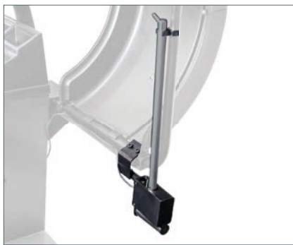
Messarm für Breitenmesslehre Measuring arm for width Bras de mesure pour des largeurs de jauge